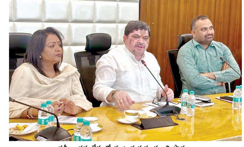
సమీక్షా సమావేశంలో మాట్లాడుతున్న మంత్రి పాస్పం

24 గంటలూ నేను అందుబాటులో ఉంటా వర్షాలకు సమస్యలు ఎక్కడా ఉత్పన్నం కాకూడదు నాలాపై వ్యర్థాలు వేసే సహించకండి జిహాచ్ఎంసీ అధికారులకు మంత్రి పాస్పం ఆదేశం