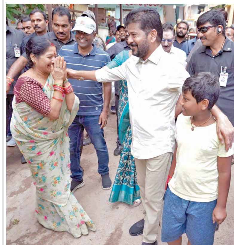
స్వయంగా సింహం తమ కాలనీ రావడంతో సంభ్రమాశ్చర్యం వ్యక్తం చేస్తున్న ఓ మహిళ