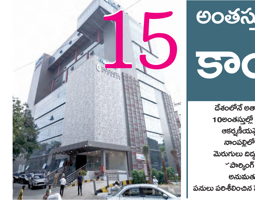
హైదరాబాద్, ఆగస్టు 10, ప్రభాతవార్త: హైదరాబాద్లో పార్కింగ్ కష్టాలను తీర్చే దిశగా ఒక అద్భుతమైన ప్రాజెక్టును తుది మెరుగులు దిద్దుతోంది హైదరాబాద్ మెట్రో రైల్. ప్రపంచంలోనే అరుదుగా ఉండే పూర్తిస్థాయి ఆటోమేటెడ్ బహుళ అంతస్తుల పార్కింగ్ వ్యవస్థను హైదరాబాద్ నడిబొడ్డున నాపల్లిలో నిర్మిస్తోంది. ఈమేరకు ఆదివారం హైదరాబాద్ మెట్రో రైల్ ఎంఓ ఎన్ఎస్ఐఐఐ ప్రాజెక్టును పరిశీలించారు. ఈ సందర్భంగా ఆయన మాట్లాడుతూ వివిధ ప్రభుత్వ శాఖల నుండి తుది అనుమతులు లభించిన వెంటనే త్వరలోనే ఇది ప్రజలకు అందుబాటులోకి వస్తుందని ఆయన స్పష్టం చేశారు. సింహం రేవంత్ రెడ్డి ఈ ప్రాజెక్టును ప్రపంచ శ్రేణి ప్రాజెక్టుగా అనుభవించే తేవాలని వేసిన ఆదేశాల మేరకు, ఈ ప్రాజెక్టును అత్యంత ఆకర్షణీయంగా రూపొందిస్తున్నామని తెలిపారు. ఇది జర్మనీకి చెందిన అత్యున్నత పాలిటెక్నిక్ సాంకేతికతతో పూర్తి ఆటోమేటెడ్ పజిల్ పార్కింగ్ సిస్టమ్ గా నిర్మించబడిందన్నారు. ఇది ప్రపంచంలోనే అత్యంత ఆధునికమైన పార్కింగ్ కాంప్లెక్సులో ఒకటిగా భారతదేశంలోనే ఇది మొట్టమొదటిదిగా తెలిపారు. మొత్తం 15 అంతస్తులు.. 15 అంతస్తులు కలిగిన ఈ పార్కింగ్ ప్రాంగణంలో 3 బేస్మెంట్లు, 7 ఫైఅంతస్తులు కలిపి మొత్తం 10 పార్కింగ్ అంతస్తులు ఉంటాయని, వీటిలో